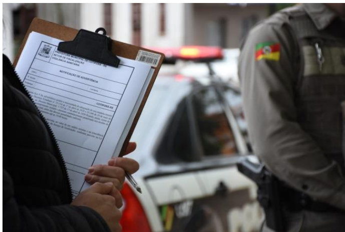
Imagem registrada em Cotiporã, durante a operação de fiscalização aos estabelecimentos, por parte dos servidores municipais, em conjunto com as Forças de Segurança Pública.