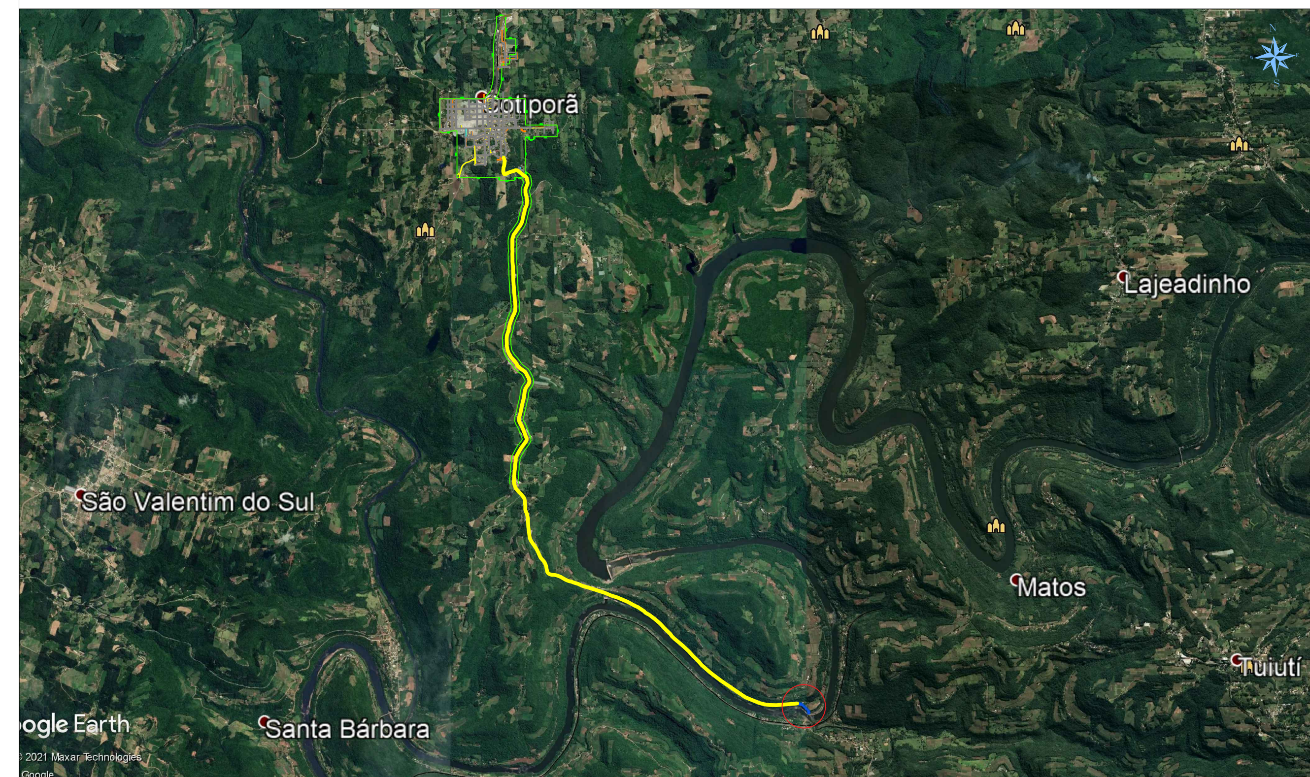
Localização da obra no Município