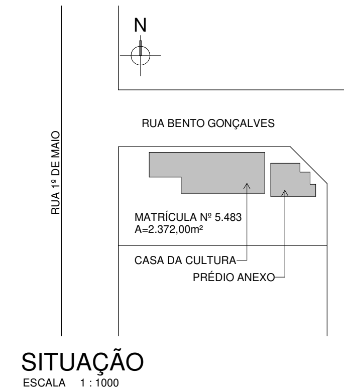
SITUAÇÃO ESCALA 1 : 1000