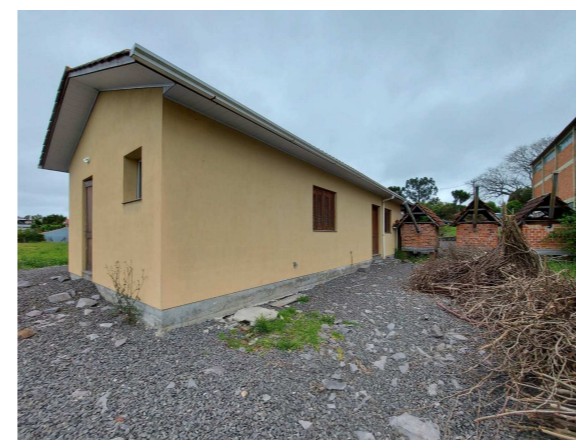
Foto da situação atual - fundos