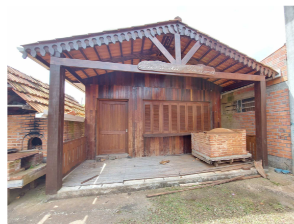
Foto da situação atual - frente