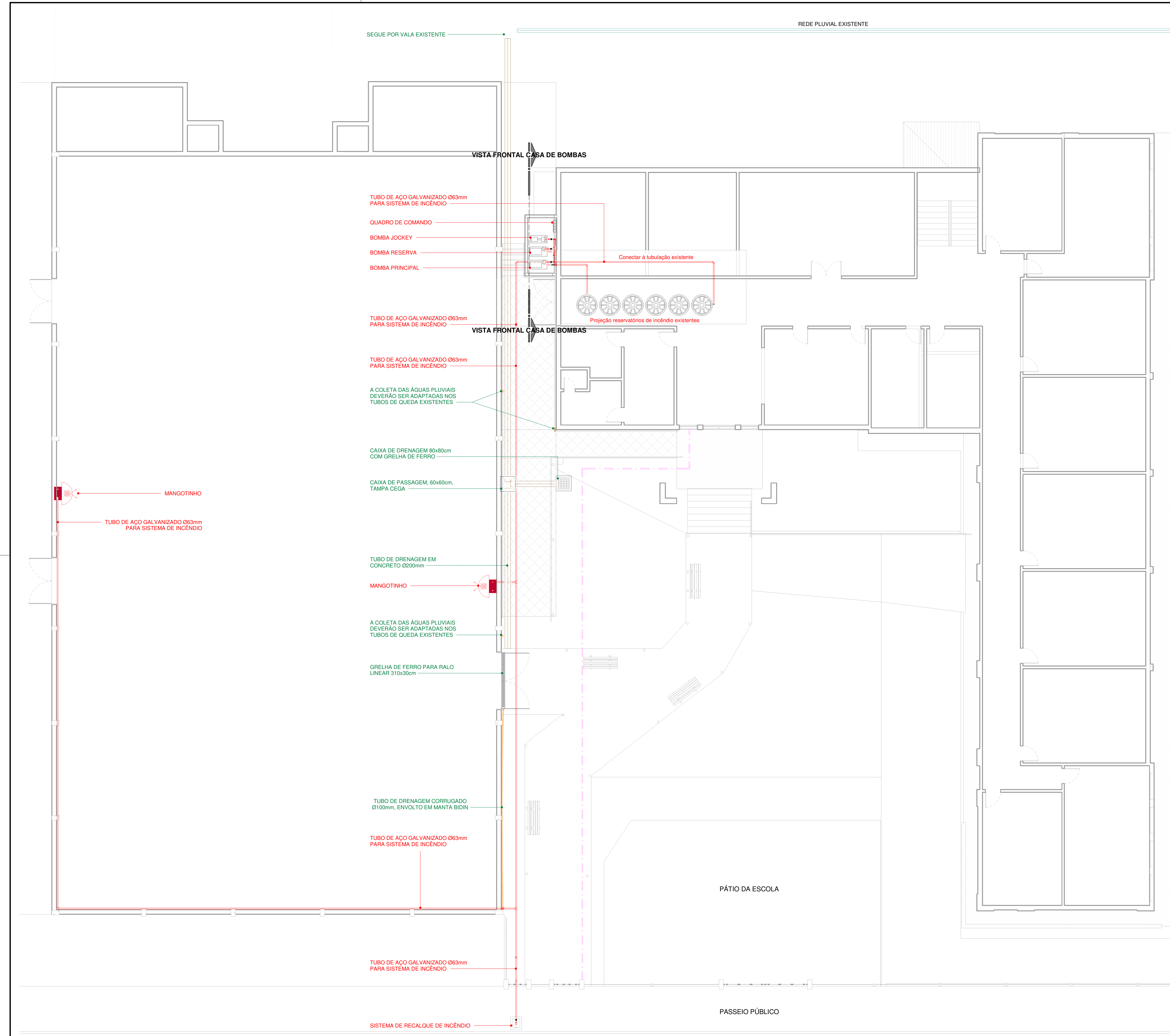
TÉRREO PPCI E DRENAGEM ESCALA 1 : 100