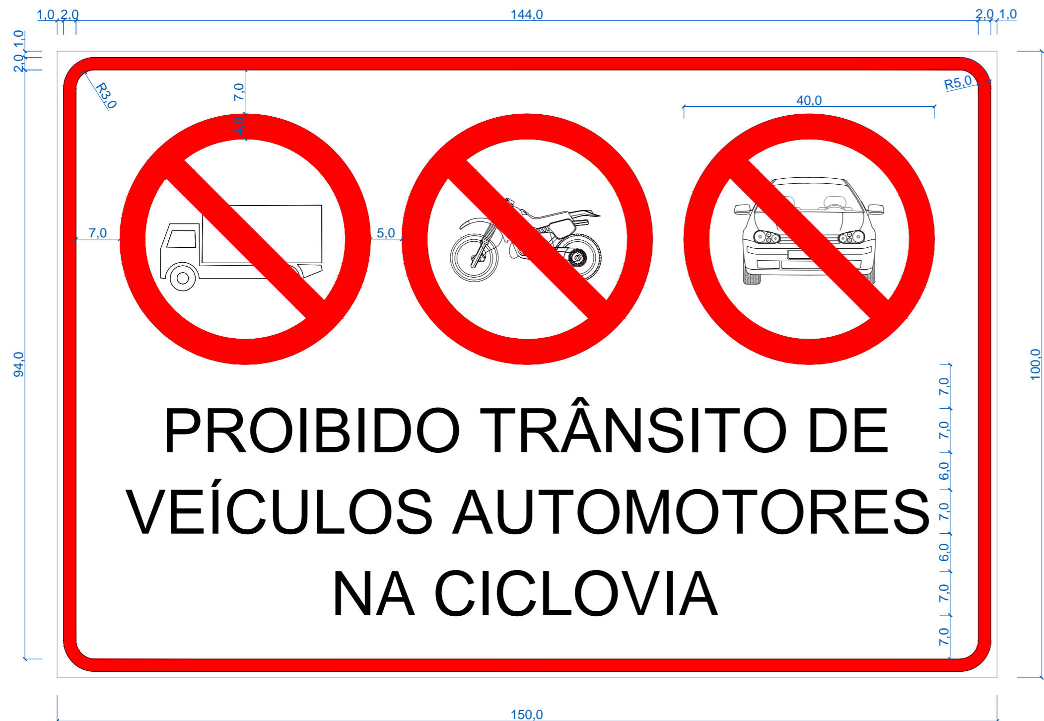
01 Detalhe - Placa Modelo 1 Sem Escala