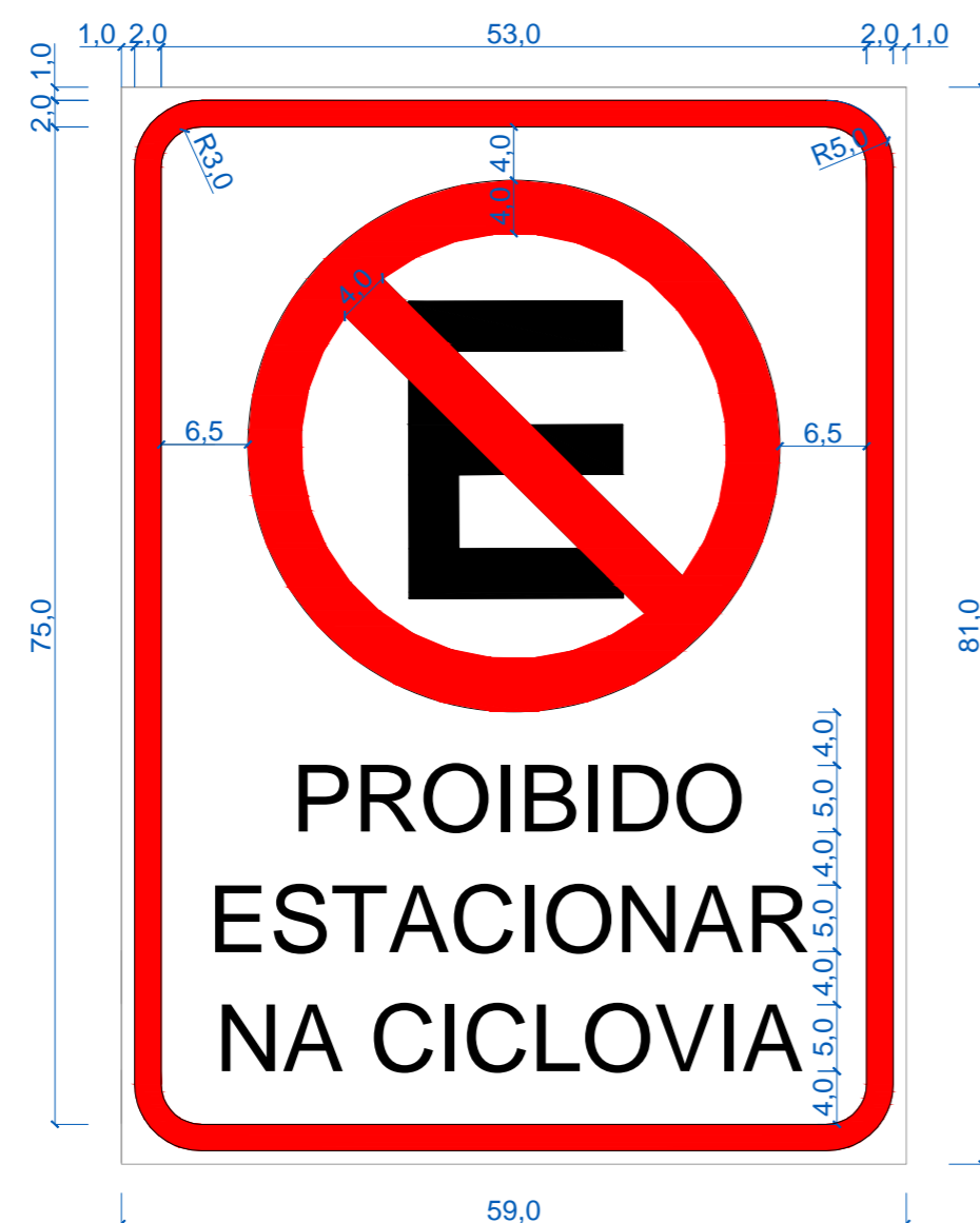
02 Detalhe - Placa Modelo 2 Sem Escala