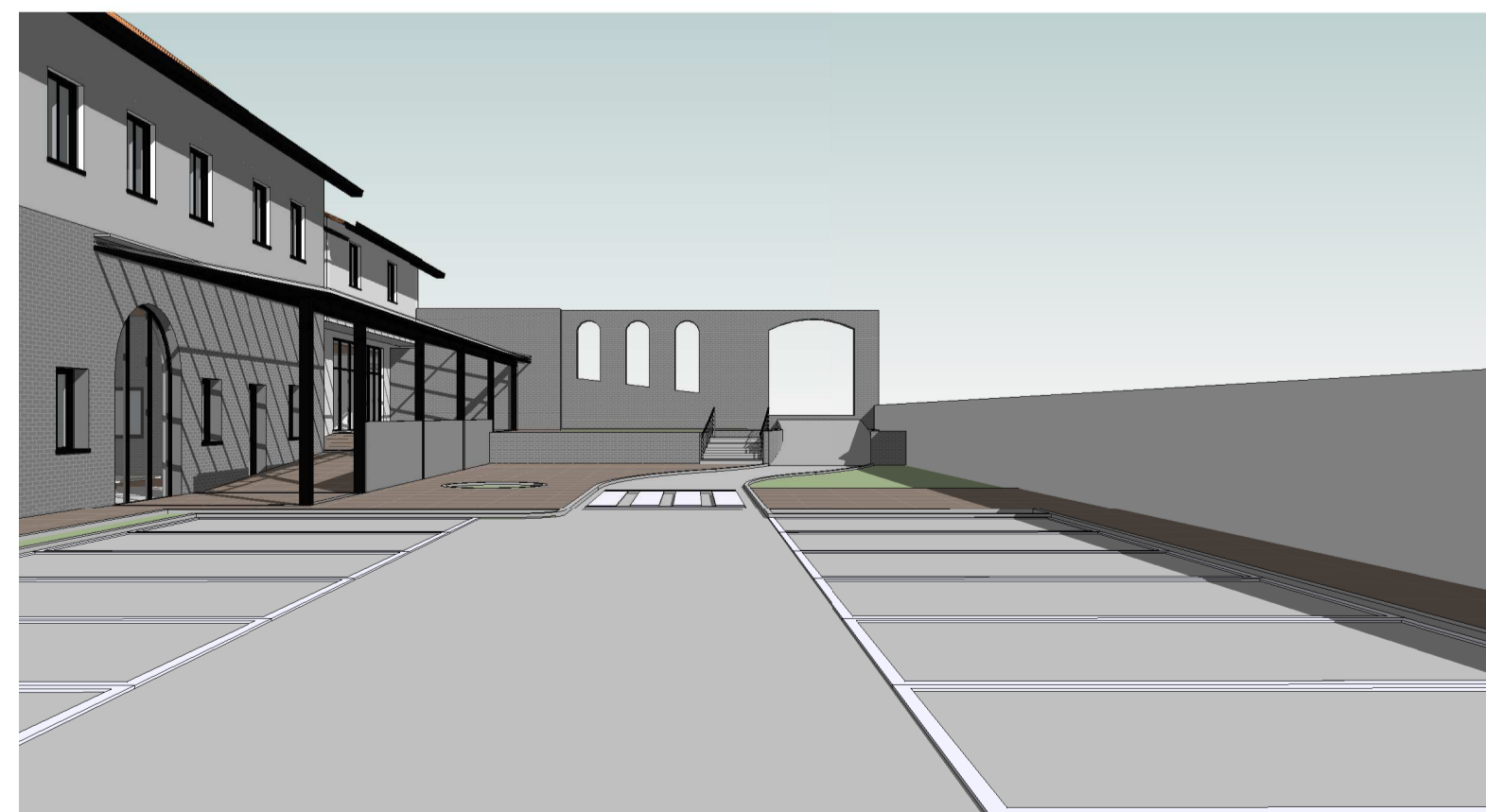
Vista 3D 7 ESCALA