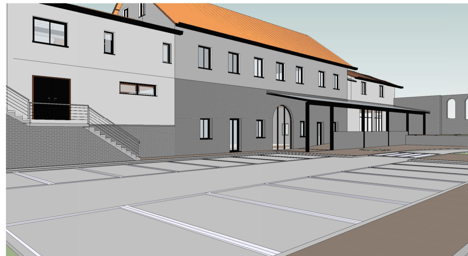
Vista 3D 8 ESCALA